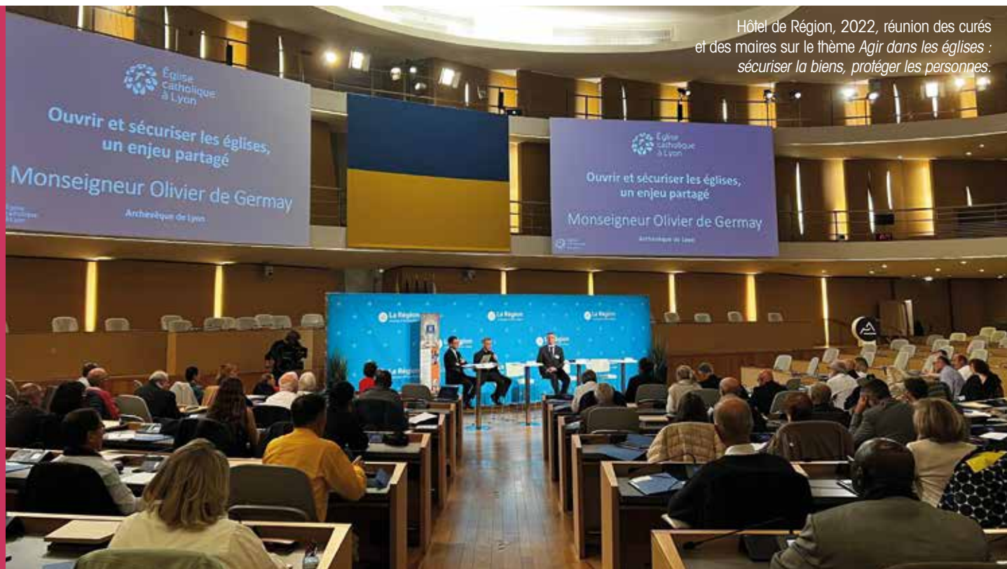
Hôtel de Région, 2022, réunion des curés et des maires sur le thème Agir dans les églises : sécuriser la biens, protéger les personnes.