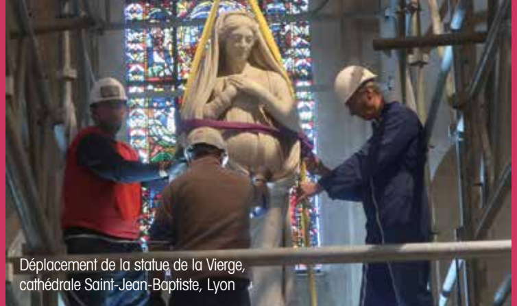
Déplacement de la statue de la Vierge, cathédrale Saint-Jean-Baptiste, Lyon