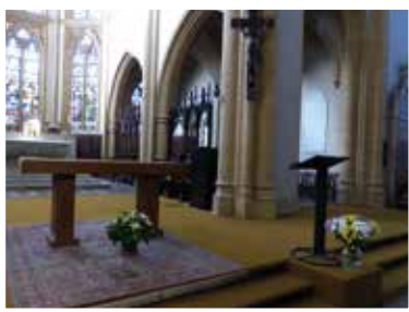
Église Saint-Étienne à Roanne : avant/après