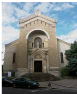
Église Saint-Augustin à Lyon (4 e ) : avant/après

Cette note synthétique s'adresse aux porteurs de projets dans les églises du diocèse de Lyon (paroisse, commune, association). Elle sera une aide pour les guider dans les démarches à entreprendre et identifier les interlocuteurs à solliciter pour les mener à bien.